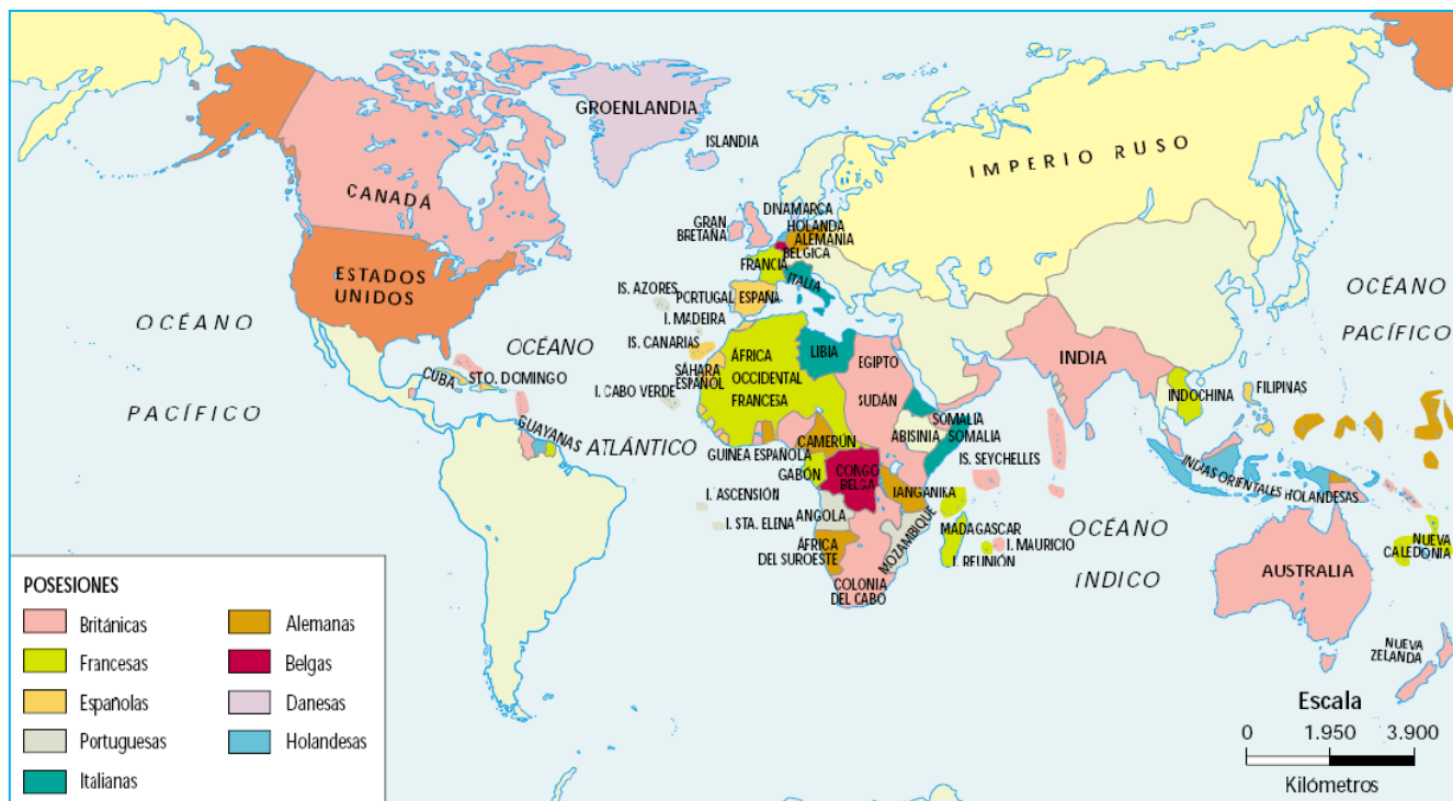
La expansión imperialista hacia fines del siglo XIX

Finalmente, hay que mencionar que algunas zonas fueron ocupadas debido a su posición estratégica, es decir, por encontrarse próximas a un estrecho, a una ruta comercial marítima o terrestre. Un ejemplo de esto es la intervención de Gran Bretaña en Egipto para controlar el Canal de Suez y la ruta hacia la India.