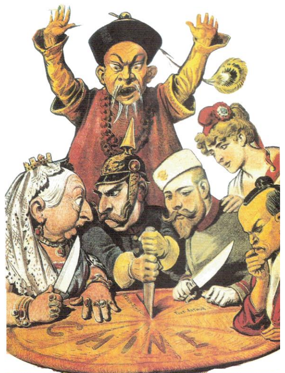
Caricatura que muestra el reparto imperialista de China por parte de Inglaterra, Alemania, Rusia, Francia y Japón.

A su vez, otros autores han creído encontrar en el aumento demográfico producido en Europa a lo largo del siglo XIX un motivo para explicar la ocupación de regiones en otros continentes, adonde se enviaba el exceso de población europea y se "exportaban" de esta manera los conflictos sociales existentes. También hay que considerar las causas psicológicas y sociológicas surgidas a partir del sentimiento de superioridad de los países europeos, algunos de los cuales impulsaban la misión de "llevar la civilización" a aquellas zonas del mundo que se encontraban en una etapa de desarrollo cultural considerada inferior.